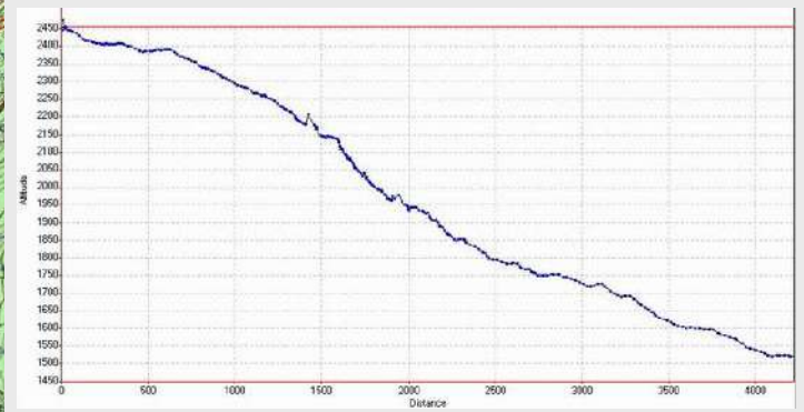
Šljeme - profil silaska

Za nama je ostalo osam popetih vrhova za 60 godina Pobede.