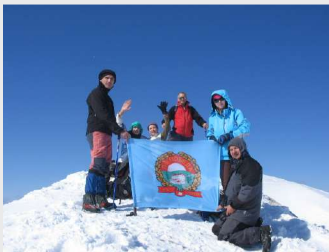
Istočni vrh Šljemena

Vreme se preko noći promenilo. Napadao je novi sneg. Zavejani šatori, vrhovi u magli nisu obećavali uspešan dan. Sačekali smo do 8 sati, uspostavili vezu sa Stepom i doneli jedinu moguću odluku - prekidamo sa daljim usponima. Pakujemo šatore i krećemo ka Žabljaku. Kako smo se približavali Žabljaku tako se vreme prolepšavalo. Rano stižemo do asfalta i odlučujemo da popnemo još jedan vrh na koji su pre nas otišli naši planinari sa Žabljaka. Penjemo se na istočni vrh Šljemena. Na pola uspona se srećemo sa grupom koja se vraća sa vrha. Nastavljamo dalje ka vrhu i stižemo. Pogled izvanredan. Kao na dlanu gledamo vrhove Durmitora. Bobot i Bezimeni nas podsećaju na kavkazku Užbu. Vraćamo se na Žabljak, pakujemo i krećemo ka Beogradu.